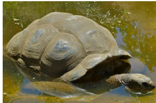
Afkoelen in een plas water

Het is erg warm en droog op Aldabra. We zijn te vinden in de graslanden, mangrovemoerassen en duinen. Vooral de graslanden zijn belangrijk, omdat we gras en struiken eten. Daar vind je ons dan ook vaak in groepen bij elkaar. Ook zand is belangrijk, omdat we een hol graven om ons te verschuilen voor roofdieren en om de eieren uit te broeden. Als de eieren uitkomen zijn de jonge schildpadden meteen zelfstandig. Aldabra reuzenschildpadden zijn vooral 's ochtends actief. Als het tijdens de dag heel erg heet wordt, dan schuilen we onder bomen en in ons hol. We koelen ook wel eens af in een zeldzame plas water. Omdat we op een koraaleiland leven, zijn we altijd omringd door zee. En al doen we het niet vaak, we kunnen wel zwemmen in de zee.