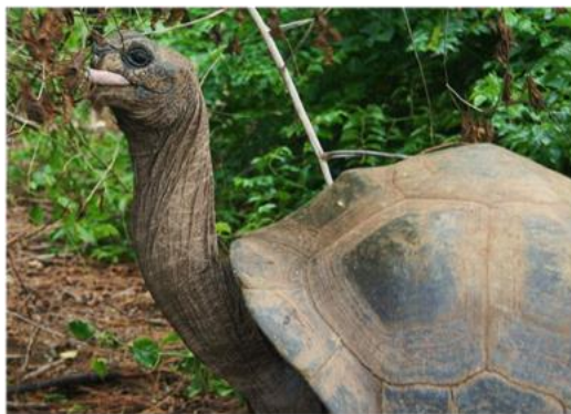
Door de lange nek kan de Aldabra landschildpad bij hoge blaadjes komen

Wij zijn één van de grootste landschildpadden ter wereld. We kunnen wel 1.20 meter lang worden en 250 kilo wegen! Misschien denken jullie dat wij reuzenschildpadden met onze grijze schilden erg op elkaar lijken, toch zijn we allemaal anders. Net als de kinderen in jullie klas, zijn wij natuurlijk niet allemaal even groot. Voor ons reuzenschildpadden is het handig om groot te zijn. Met onze grote koepelvormige schilden zijn wij goed beschermd tegen roofdieren. Ook is het handig om een lange nek te hebben.