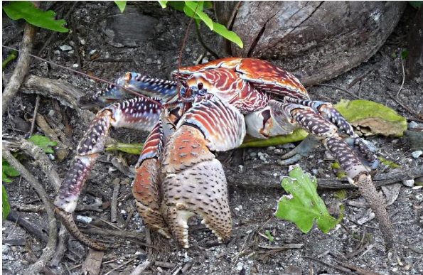
Kokoskrabben jagen op de eieren en jongen van de Aldabra landschildpad

We eten vooral grassen en struiken. Het maakt ons niet zoveel uit welke grassen we eten. Af en toe eten we het vlees van dode dieren. Soms zelfs van een dode schildpad. Sommige planten in ons leefgebied hebben zich aangepast aan ons. De planten hebben zich zo aangepast dat hun zaden onderaan de plant groeien in plaats van bovenaan. Daardoor eten wij de zaden niet op en kunnen de grassen en kruiden zich toch verspreiden. Deze grassen en kruiden noemen we ook wel 'schildpadgras'. Er zijn trouwens ook planten waar we de zaden wel van eten. Die zaden verspreiden we via onze poep.